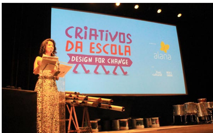
• Cerimônia de entrega do Prêmio Desafios Criativos da Escola/Instituto Alana ao Projeto Jovem Explorador e o Ecomuseu - São Paulo - 2015