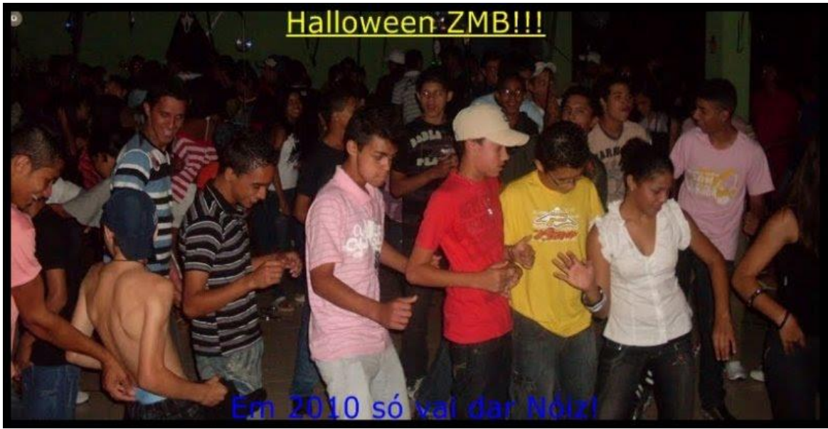
Gravação da "Conexão BR FR" - 2009