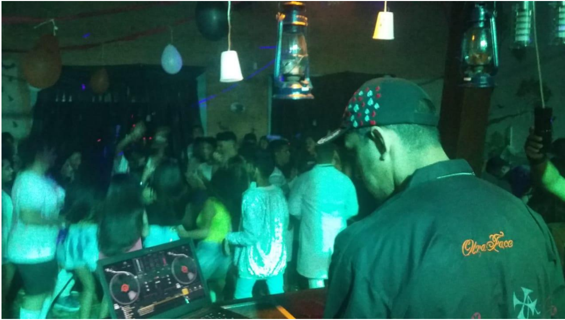
Halloween 2010 – Otraface - Baile do Saci