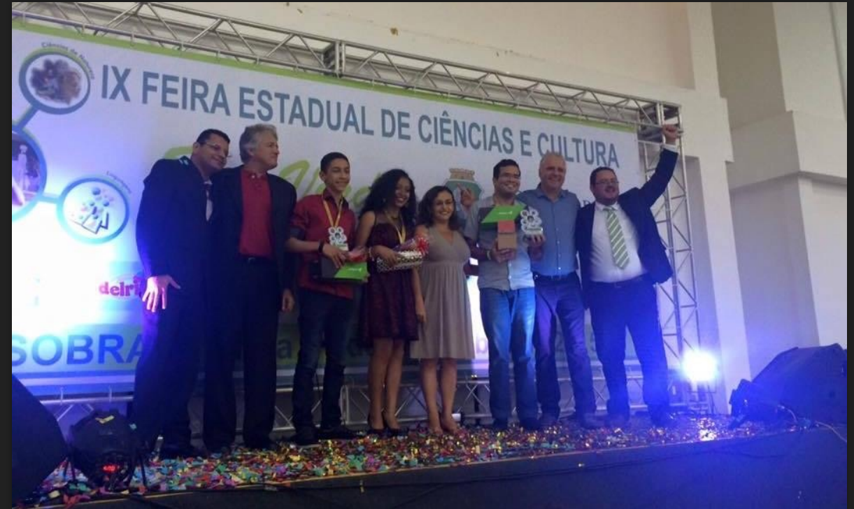
Premiação na IX Feira Estadual de Ciências e Cultura – 2015