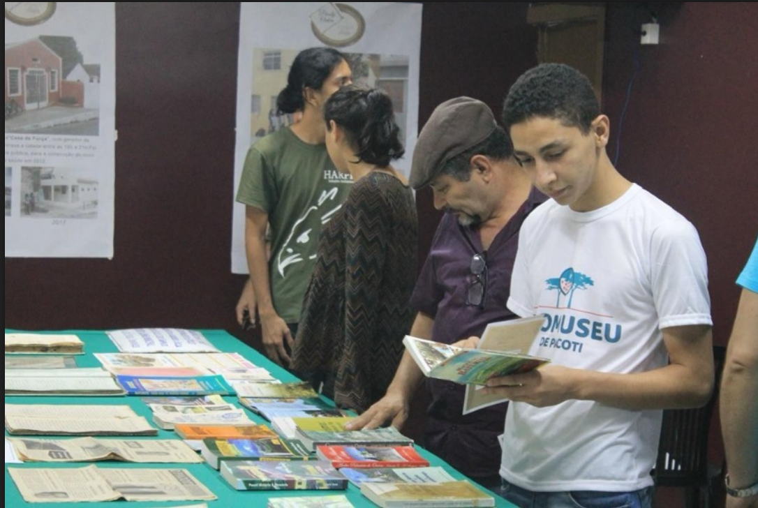
Experiência como pesquisador em história, cultura e meio ambiente, desde 2014. (UECE / Ecomuseu de Pacoti / UFC)