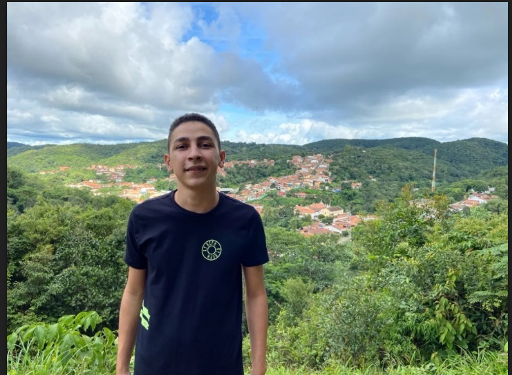
Portal Lunetas Conheça 8 jovens do ativismo ambiental

https://lunetas.com.br/jovens-ativismo-ambiental/