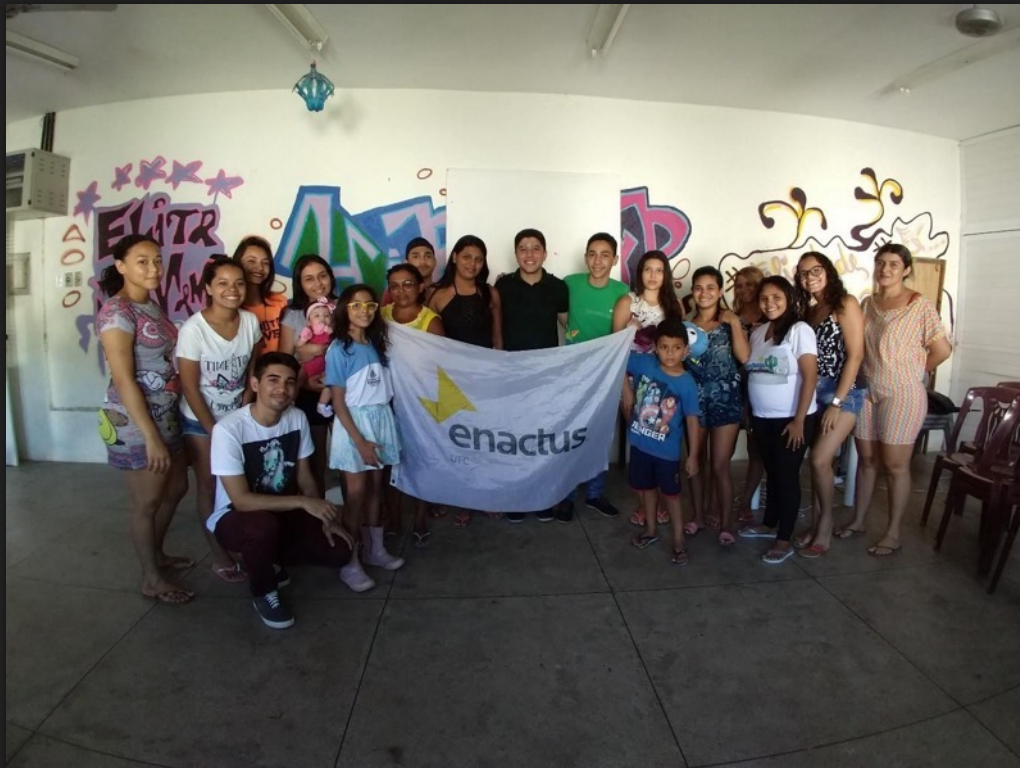
Integrante do time Enactus, de projetos sociais e de empreendedorismo, 2019.